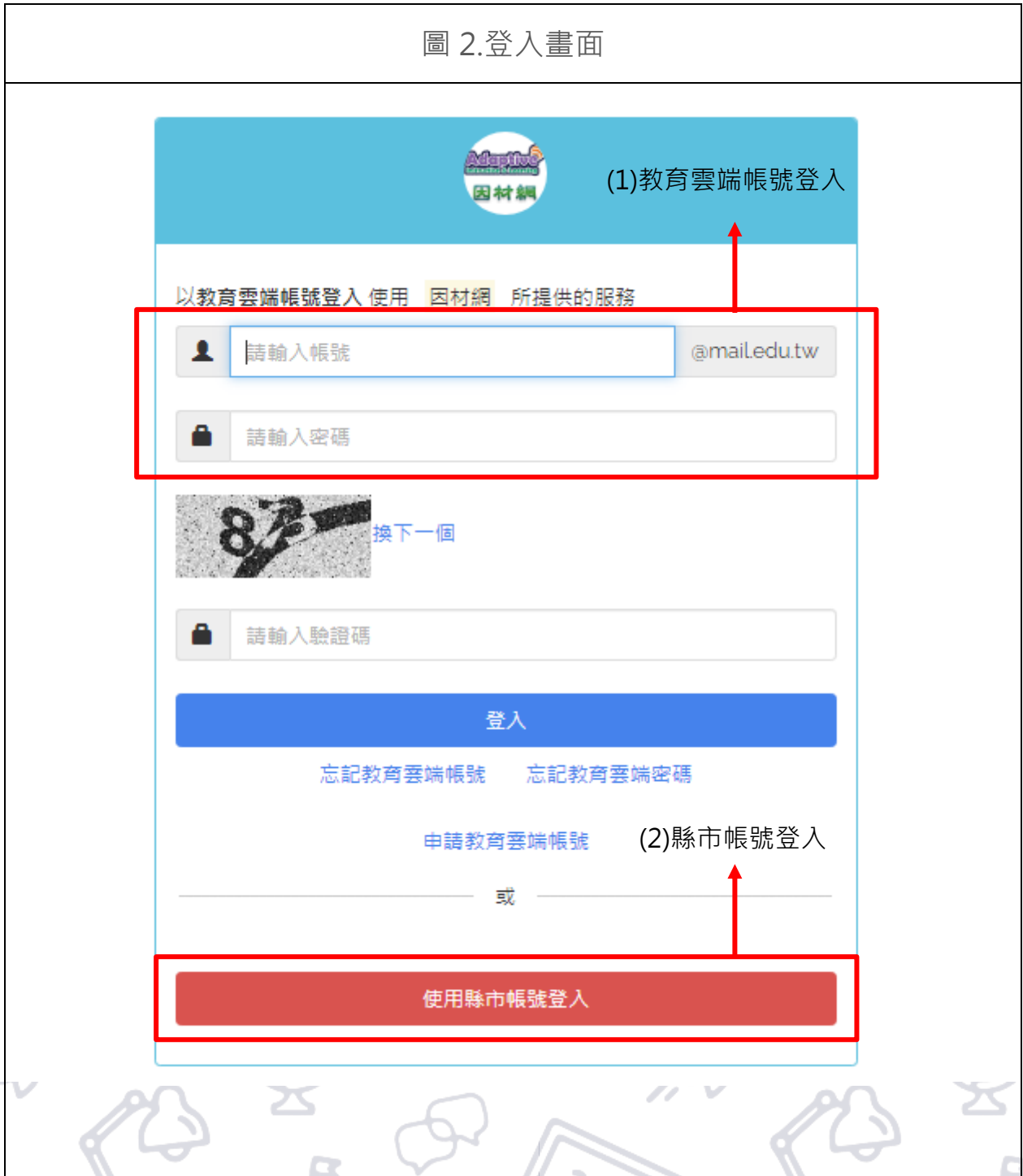
圖 3. 「教育雲端帳號」或「縣市帳號」登入