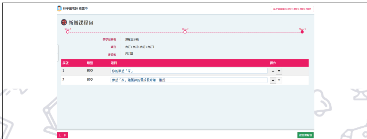
圖 19. 建立課程包步驟三