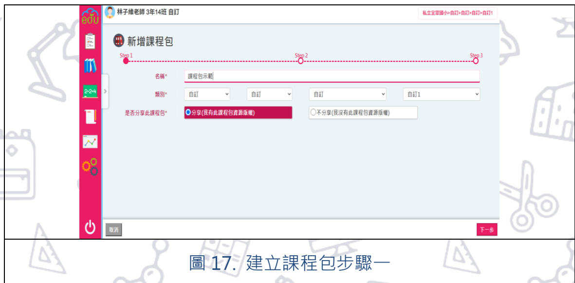
圖 17. 建立課程包步驟一