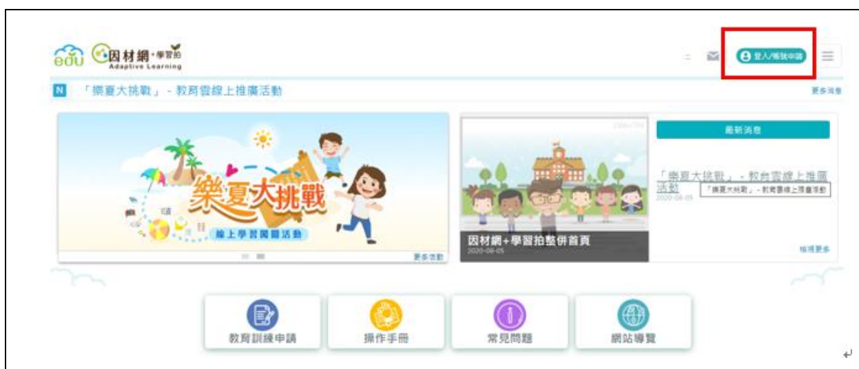
圖 1.因材網&學習拍首頁