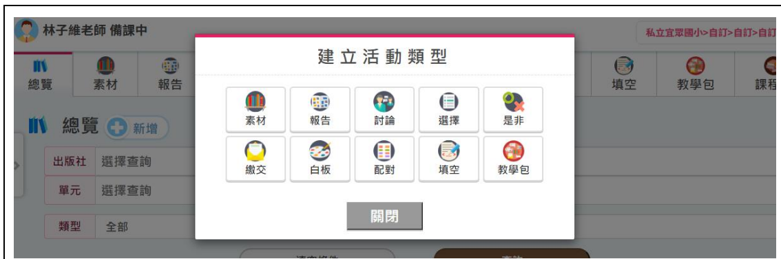
圖 10.新增教材彈跳視窗