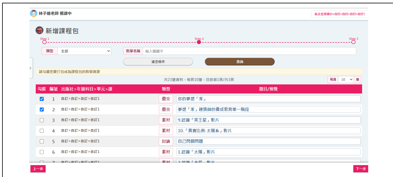
圖 18. 建立課程包步驟二

4. 步驟二，會顯示已建立的教材列表，勾選新增為課程包的教材項目，點選「下一步」(圖 18)