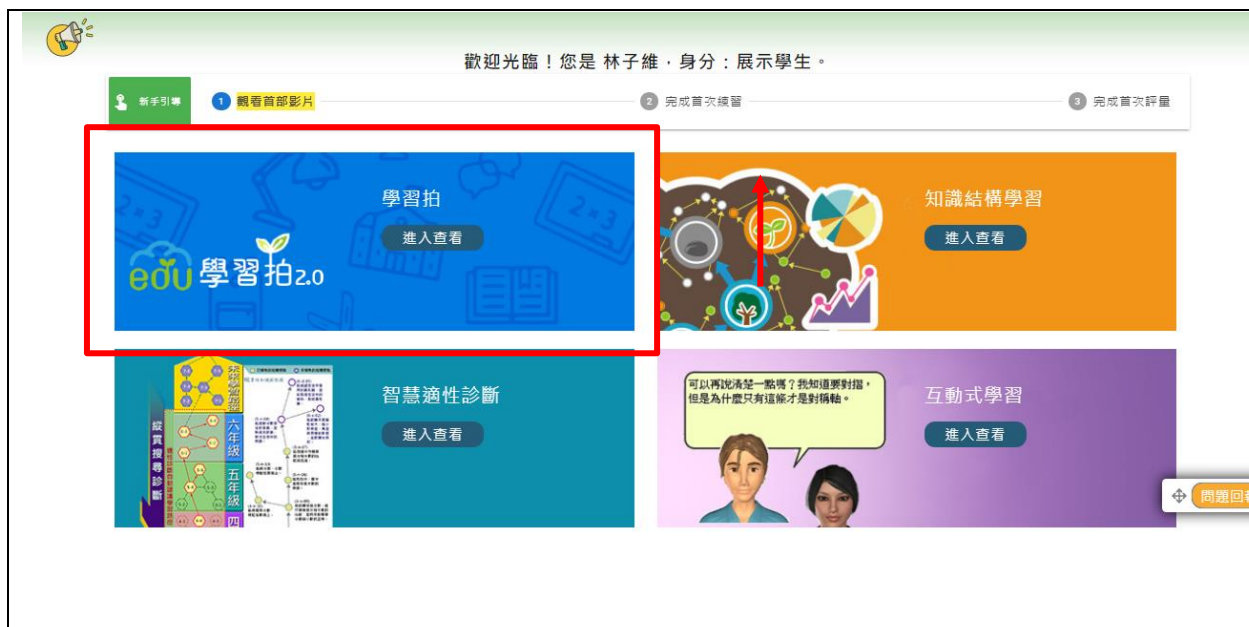
圖 4.因材網與學習拍功能首頁