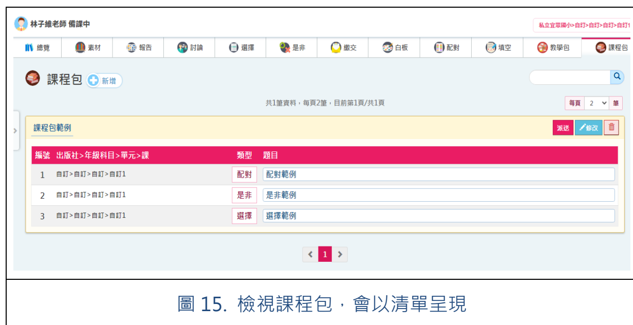
圖 15. 檢視課程包，會以清單呈現