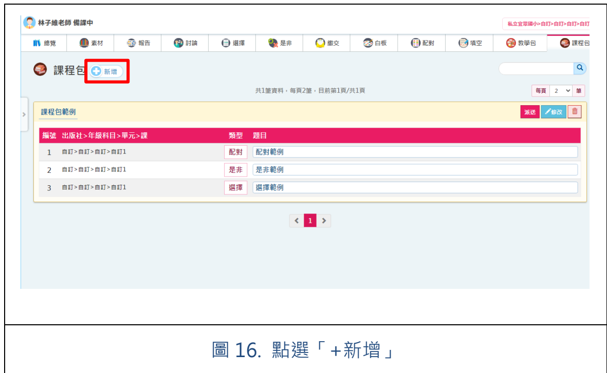
圖 16. 點選「+新增」