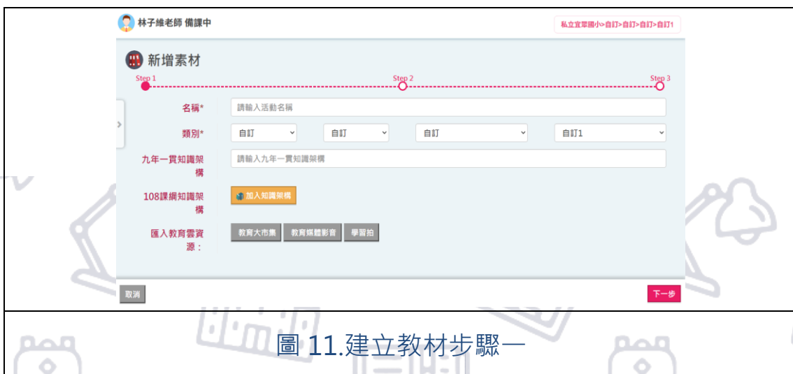
圖 11.建立教材步驟一